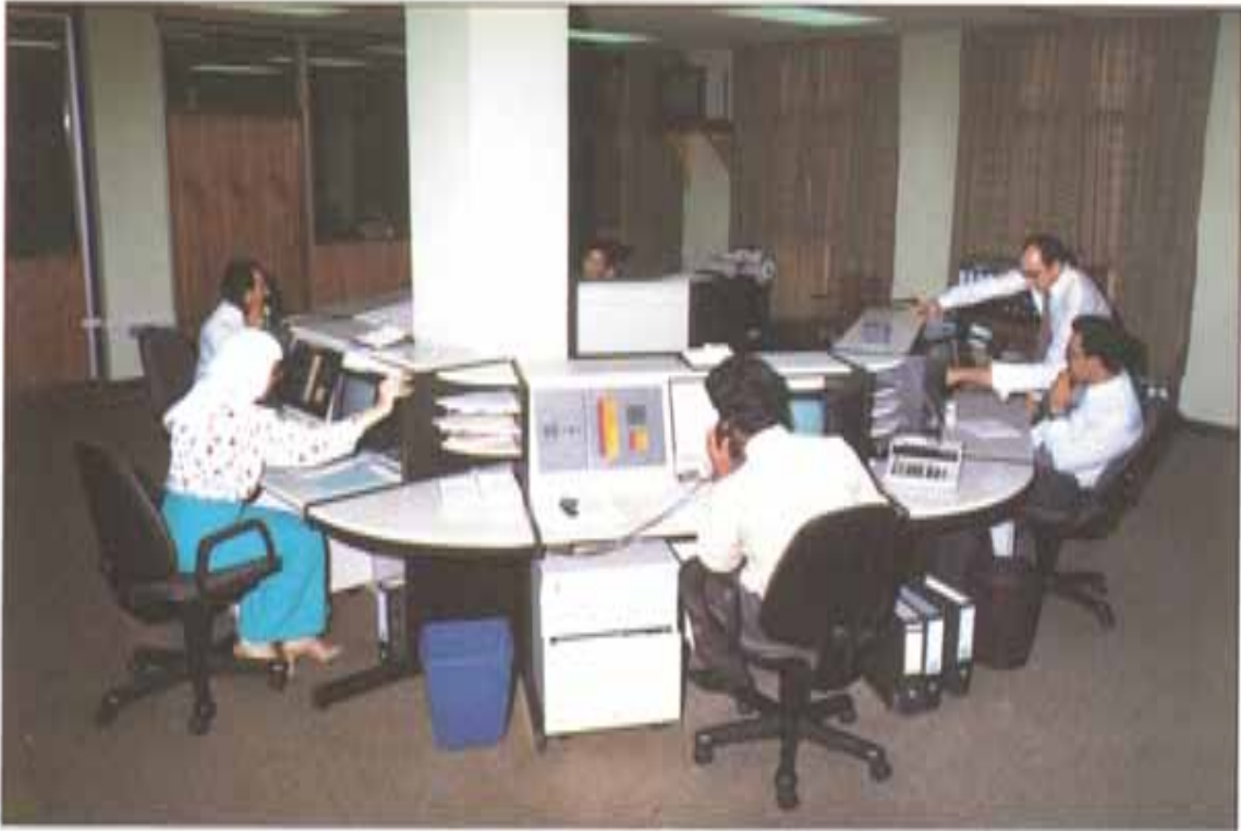
غرفة التعامل الإدارة العامة - الدوحة