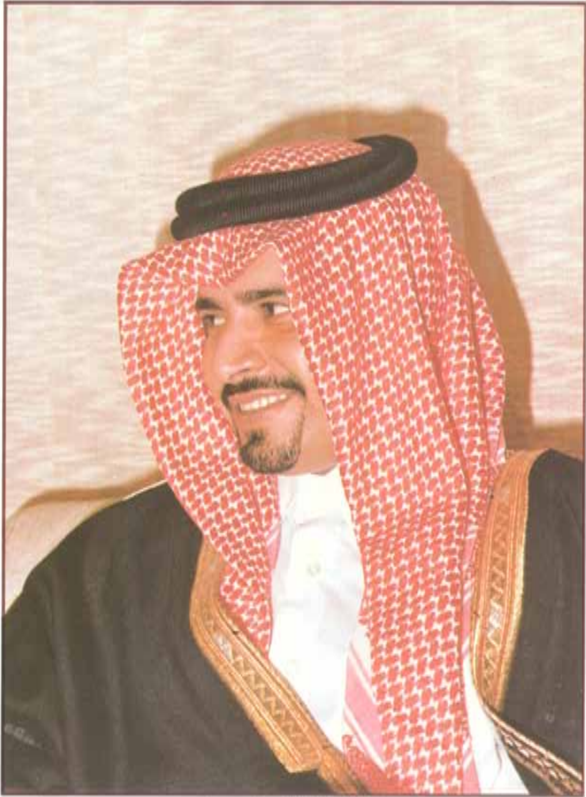
معالي الشيخ جبر العزير بن خليفة آل ثاني وزير المالية والبتروم