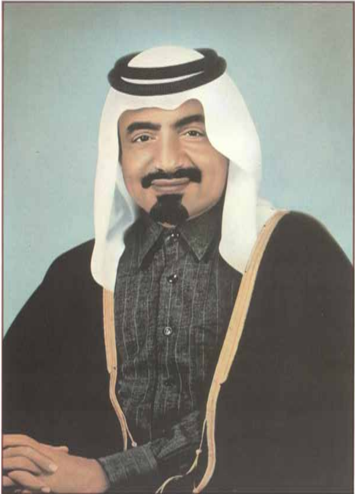
حمزة حميد آل الشيخ خليفة بن حمد الثاني أمير دولة قطر