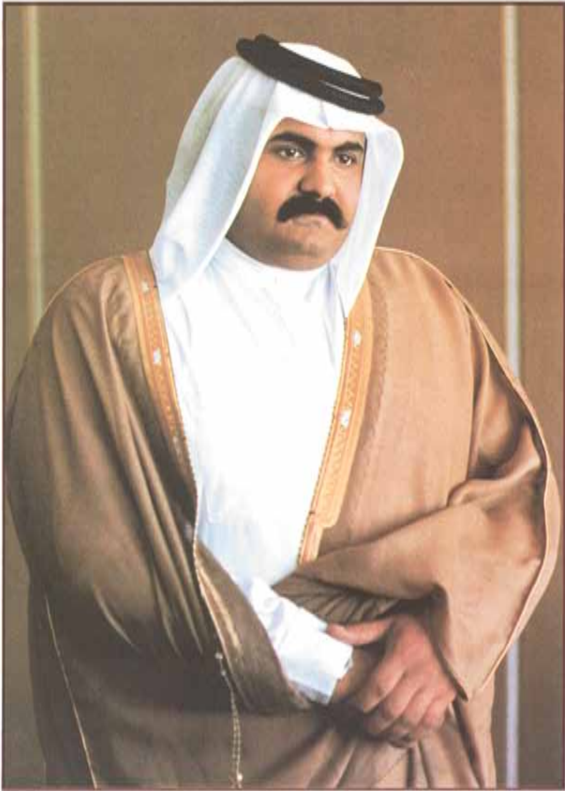
صاحب السمو الشيخ حمد بن خليفة آل ثاني ولي العهد وزير الدفاع