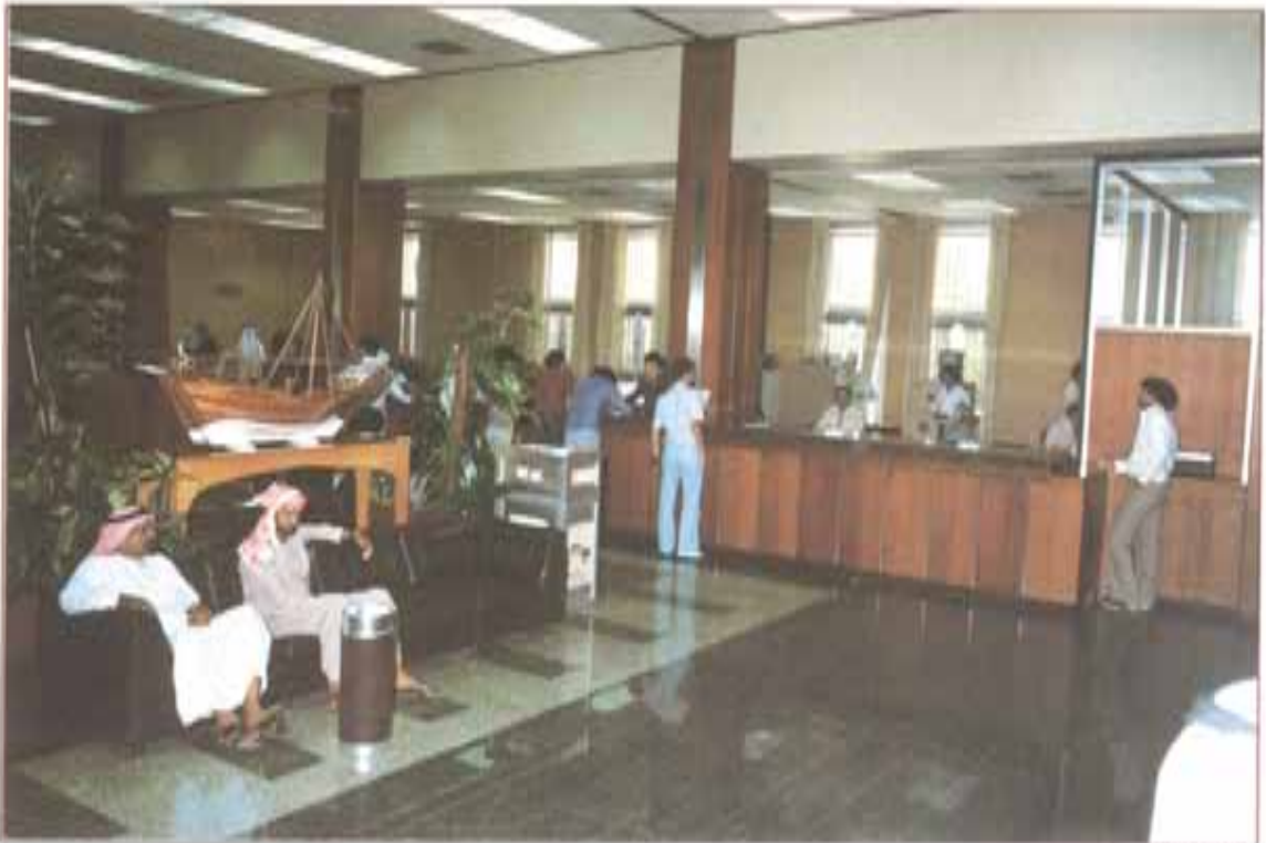
القاعة الرئيسية الفرع الرئيسي - الدوحة