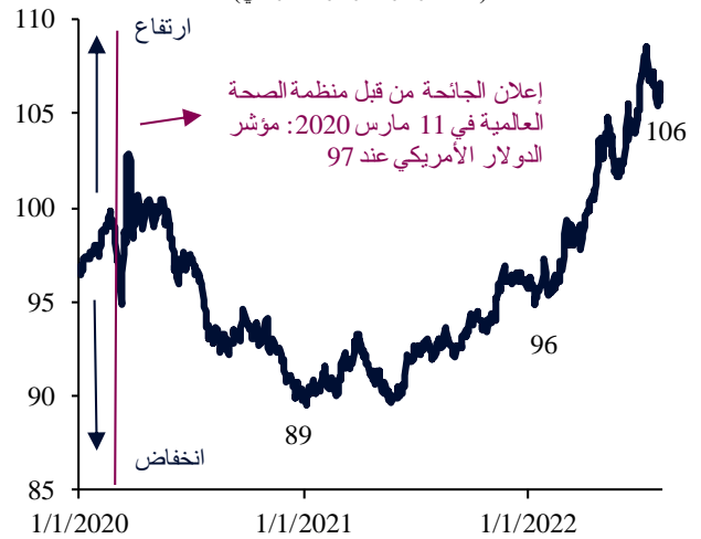
مؤشر الدولار الأمريكي (نقاط مؤشر الدولار الأمريكي)

في الواقع، شهد مؤشر الدولار الأمريكي (DXY)، وهو معيار مرجعي تقليدي يقيس قيمة الدولار الأمريكي مقابل سلة مرجحة من ست عملات رئيسية، ارتفاعاً بأكثر من 10% من مستويات ما قبل الجائحة، وبأكثر من 10% في السنة حتى تاريخه، وبأكثر من 19% بالمقارنة مع المستويات المتدنية للغاية التي بلغها بعد الجائحة في أوائل عام 2021.